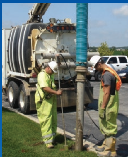
Manguera Amphibian de PVC con interior de Poliuretano, altamente flexible para succión y descarga de productos abrasivos. Uso rudo con resistencia a la abrasión, al agua y al aceite.