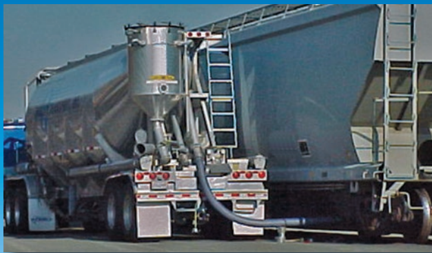
Manguera metálica para descarga de materiales a granel desde tolvas.