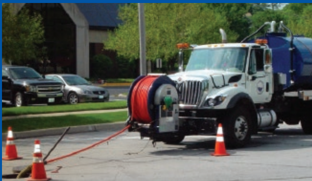
Manguera termoplástica de alta presión para limpieza de drenajes.