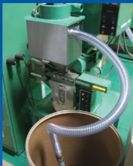
Mangueras de PVC Series WE/WT con y sin alambre antiestático para la transferencia mediante sistemas neumáticos de pellet y otros materiales secos granulados.