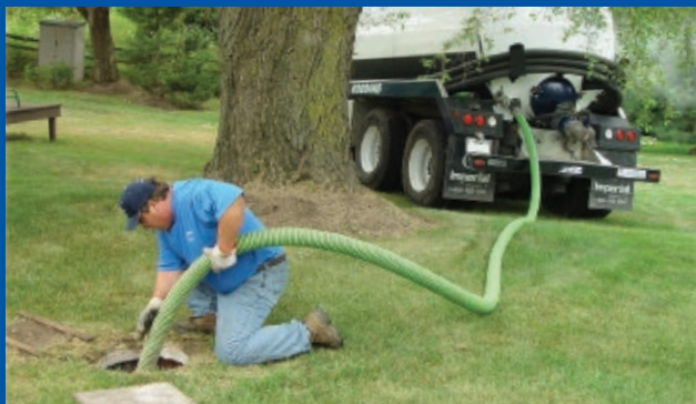
Mangueras de EPDM para limpieza de fosas sépticas. La original Tiger Green (verde) y las nuevas series Tiger Yellow (amarilla), Tiger Blue (azul) y Tiger Red (rojo).